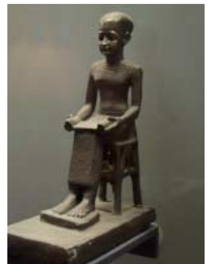
Votivbild Imhotep, 600-400 v. Chr. (Louvre)

Imhotep muss man wohl weitgehend als eine mythologische Figur einschätzen. Namentliche Erwähnungen bringen ihn nicht nur in eine Beziehung zur Bildhauerei sondern auch zur Architektur, als Erbauer des Zikkurats von Sakkara. Weitere namentliche Erwähnungen rücken ihn in die Nähe des Pharaos als dessen Kronprinz und Kanzler. Im Verlauf der ägyptischen Geschichte hatte sein Ruf legendäre Dimensionen angenommen, die ihn zum Stammvater aller Baumeister werden ließen, vergleichbar der griechischen Sagenfigur des Dädalos, dessen Name den Griechen zum Synonym für den architektonischen Erfindergeist wurde. Das hohe Ansehen des Architekten als Künstler leitet sich im Mythos ab von seiner engen Beziehung zu den Göttern. Denn Auftraggeber für den Bau von Tempeln sind immer die Götter selbst. Das ist auch der jüdischen und christlichen Tradition nicht